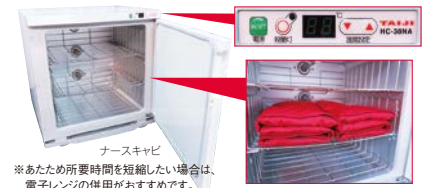
※あたため所要時間を短縮したい場合は、電子レンジの併用がおすすめです。

国内の業務用厨房機器メーカーとして信頼と実績のあるタイジ社のウォーマー「ナースキャビ」を採用しています。マイコン制御で30℃~90℃で温度設定ができるので、季節や設置環境の温度に合わせたきめ細かい対応が可能です。内部はスライド式の3段タイプ。1段にお腹・腰用6個、首・肩用4個を収納できます。